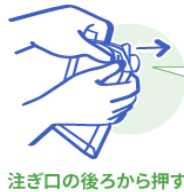
注ぎ口の後ろから押す