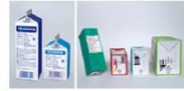
テトラパックの紙容器の一例

テトラパックの紙容器には、底面や、開口部の反対側などにテトラパックのマークがついています。