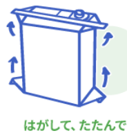
はがして、たたんで

フラップをはがしてたたんでから、注ぎ口を後ろから押すと、簡単に取り外すことができます。(以下の方法で取り外せないタイプの注ぎ口もあります。ケガ等にご注意して切り取るなどしてください。)