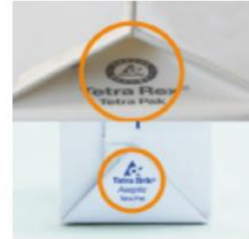
テトラパックのマーク表示の一例

テトラパックのマークのない紙容器が入っていた場合は、それらを除いた重量がベルマーク点数の対象となります。